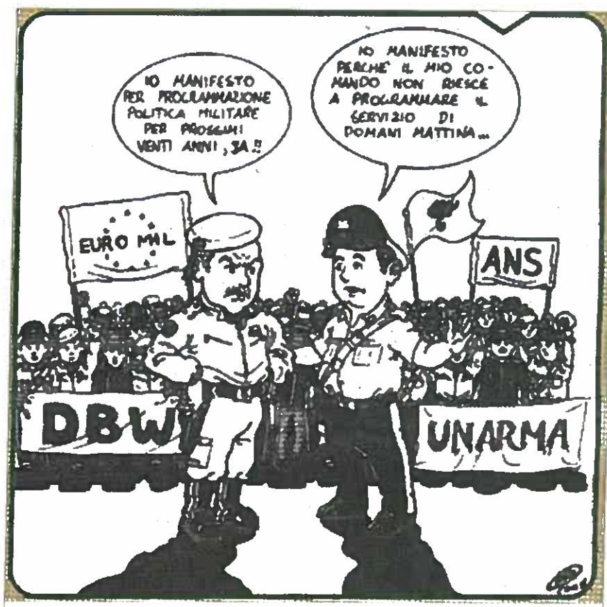
Cartoon da revista militar italiana Il Giornale Carabiniere

Para além destas dificuldades acresce dizer que ainda um terço dos Estados membros da UE - entre os quais a França e o Reino Unido - negam aos seus militares o direito fundamental ao associativismo, inviabilizando qualquer