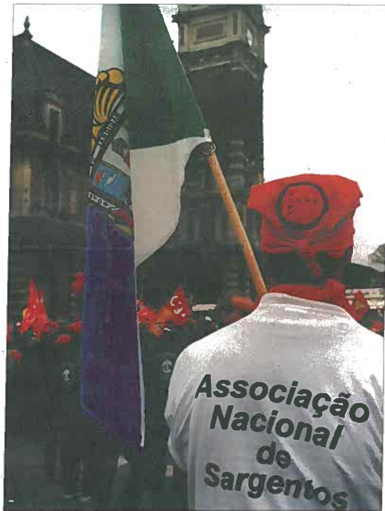
ANS participou na iniciativa da Euromil