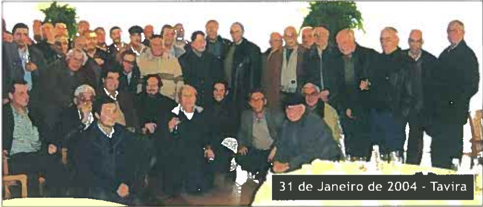
31 de Janeiro de 2004 - Tavira