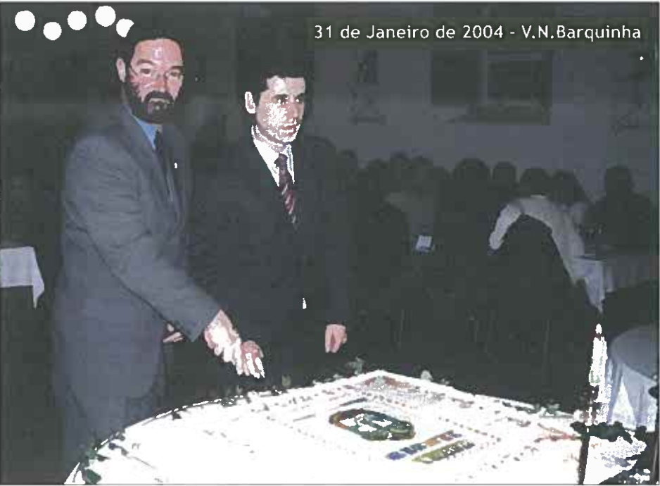
31 de Janeiro de 2004 - V.N.Barquinha