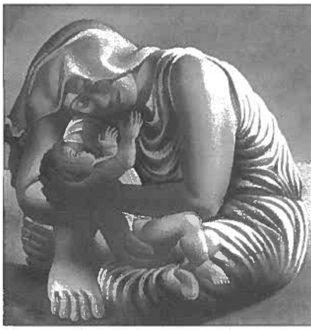
"A Maternidade", Picasso, 1935

Se bem que o dia da criança, do homem ou da mulher devam de facto, ser todos os dias, há datas que pelo seu significado não nos podem deixar indiferentes. Não estamos, ainda, a fazer referência àquela madrugada de tão grande significado para todos nós portugueses, cujo trigésimo aniversário se avizinha. Estamos a falar daquele 8 de Março, em 1857, em que as operárias da indústria têxtil, em greve, ousam desfilar pelas ruas de Nova Iorque, reivindicando a redução da jornada de trabalho de 16 para 10 horas e salários iguais aos dos homens.