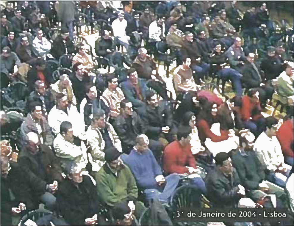
31 de Janeiro de 2004 - Lisboa

deve fazer parte da agenda das futuras reuniões da ANS com o Governo e com outros órgãos de soberania.