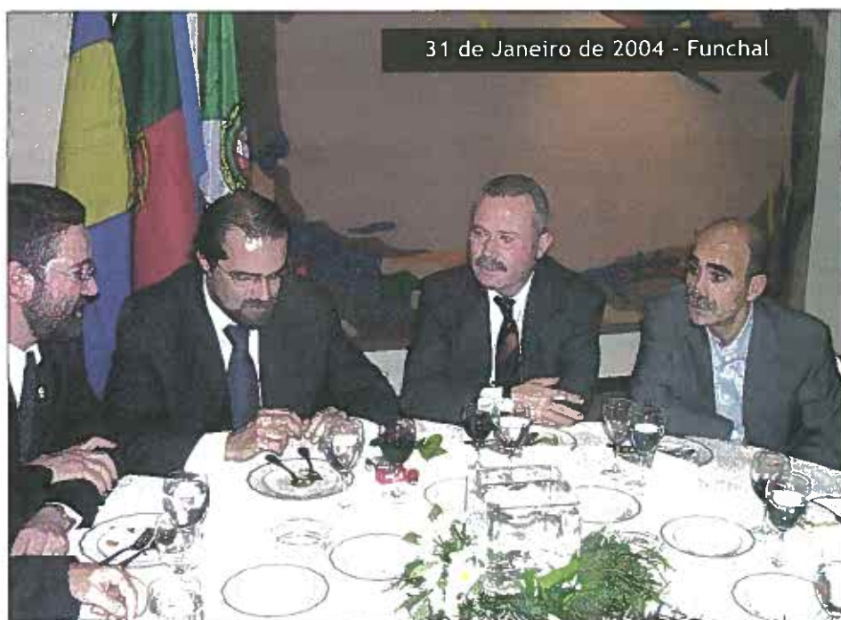
31 de Janeiro de 2004 - Funchal

Aqui, no meu entender, está a solução primária para contornar os problemas que a nossa classe atravessa. Temos e devemos exigir para que os novos quadros oriundos da ESE ou de outras escolas militares sejam possuidores de um grau académico para que, no futuro possam ter maior peso nas rondas de negociações com os nossos governantes e, por outro lado, podermos obter maiores ganhos sobre o reconhecimento formativo e informativo da nossa classe perante a opinião pública. Uma melhor afirmação, por uma maior e melhor credibilização dos Sargentos dentro e fora do País, deve ser uma exigência capital que