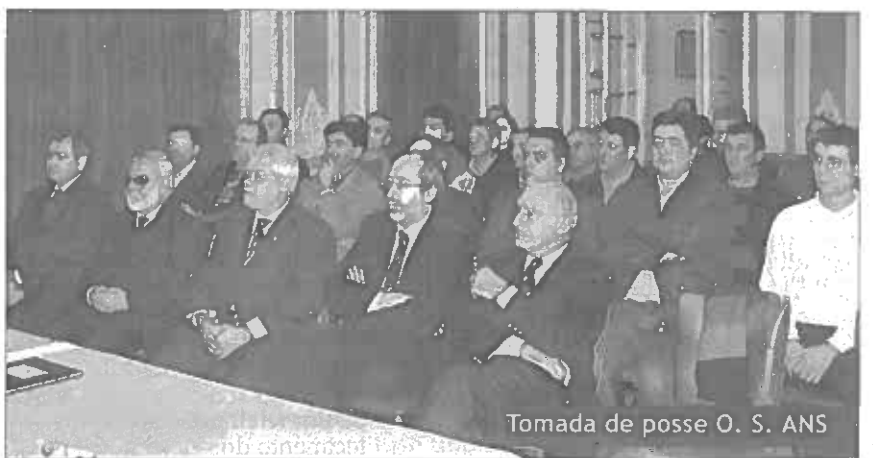
Tomada de posse O. S. ANS

E em todas as matérias e áreas que aos Sargentos digam respeito.