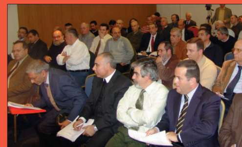
Encontro sobre Justiça e Disciplina