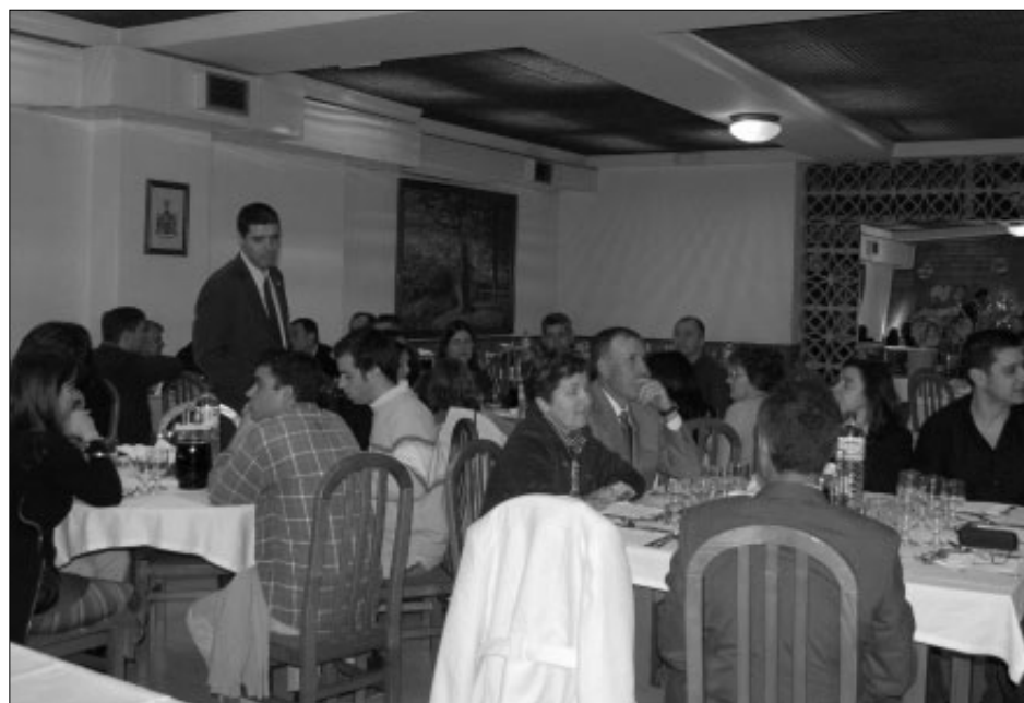
Dois pormenores da sala onde decorreram as cerimónias

numa guerra. As minhas batalhas são travadas no campo das ideologias e dos afectos.