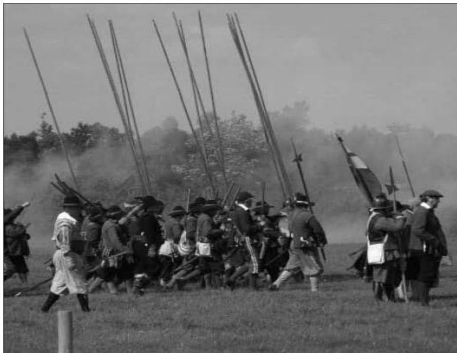
Foto em cima: Infantaria em progressão: O controlo da formação no terreno era uma das tarefas do Sargento-Mor. Reconstituição, Kelmarsh Hall, 2007.