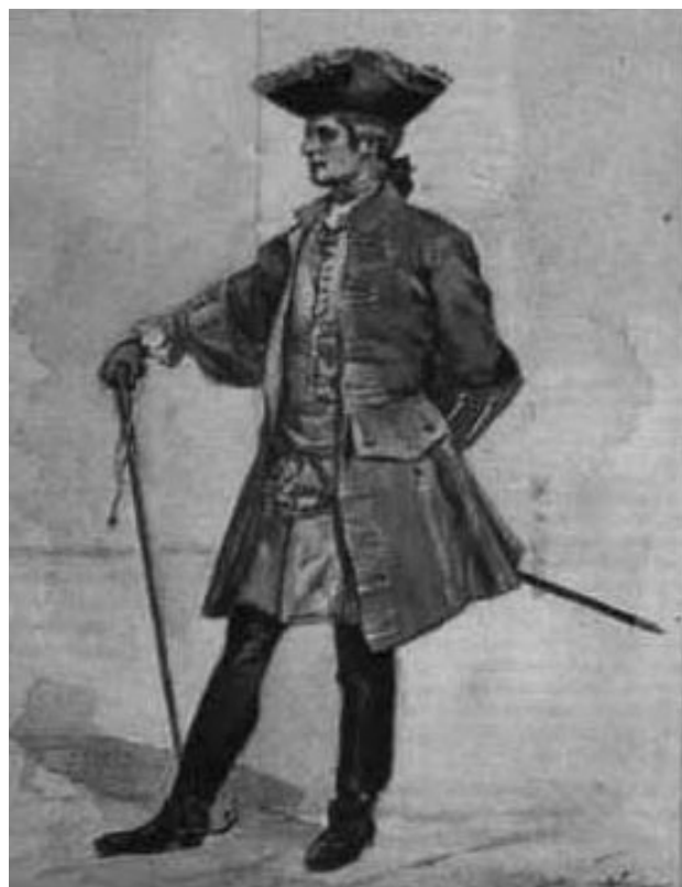
Ao lado: Sargentos houve que o Rei nobilitou. O Sargento-Mor foi um deles». Na imagem, Sargento-Mor de 1740. Colecção de aquarelas do Coronel Ribeiro Arthur. (in Arquivo Histórico-Militar)