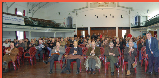
Comemorações do Dia Nacional do Sargento