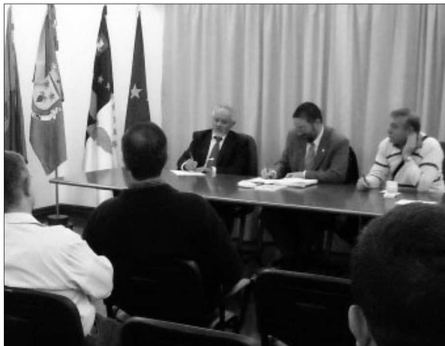
Sessão comemorativa do 31 de Janeiro em Ponta Delgada

Apesar de termos atravessado épocas festivas, nem por isso a actividade associativa deixou de exigir grande entrega por parte da massa associativa e particularmente dos dirigentes que têm conduzido os destinos da nossa associação. Particular destaque merece a comemoração do "31 de Janeiro – Dia Nacional do Sargento", que durante mais de duas semanas, de Norte a Sul do País, incluindo as Regiões Autónomas, mobilizou um significativo número de associados, familiares e dirigentes associativos, numa demonstração de grande unidade, determinação e confiança. Tanto quanto sabemos, não há muitas organizações, no nosso país, que durante tanto tempo e com esta abrangência nacional, comemorem uma data específica com tal empenho. Só a força dos Sargentos de Portugal o torna possível!