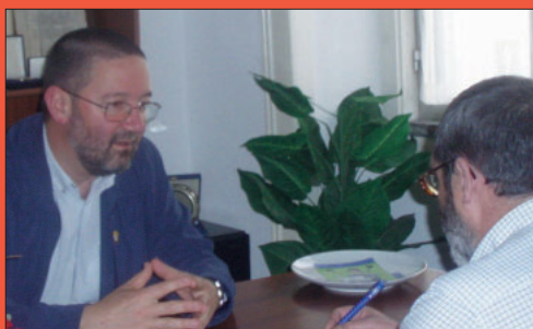
À conversa com presidente da ANS